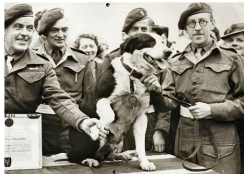
Rob le chien parachute en Normandie lors du débarquement